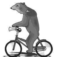
montar en bicicleta