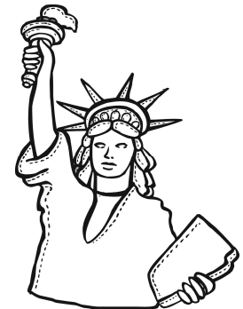
La Estatua de La Libertad