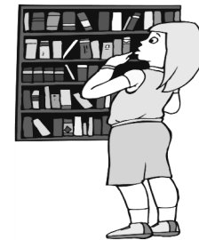
Me gusta mucho ir a la Biblioteca Nacional de México.