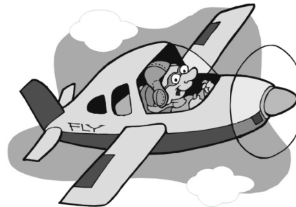
El avión vuela alto.