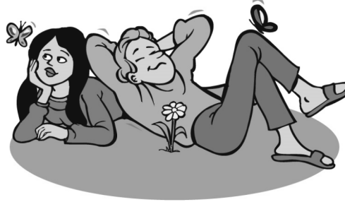
Un día feliz en el parque.