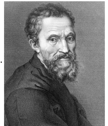
marzo, 1475 – febrero, 1564

La decoración del techo de la Capilla Sixtina, trabajo solicitado por el Papa y que duro 4 años. Allí pintó más de 30 personas, pero ninguna igual a la otra.